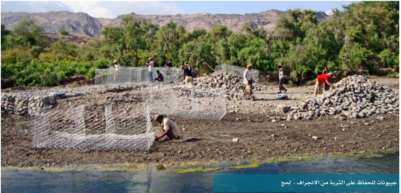
جيبونات للحفاظ على التربة من الانجراف - لحج

تمت الموافقة على 6 مشاريع بكلفة تقديرية تقارب 1.6 مليون دولار، يستفيد منها استفادة مباشرة أكثر من 9,530 شخصاً (51% من الإناث)، وتتولد عنها حوالي 68,700 يوم عمل. تتوزع هذه المشاريع على الطرق الريفية (بطول 45 كم)، ورصف المدن (بمساحة 18,110 م 2 ). وبالتالي، فإن الإنجاز التراكمي للقطاع بلغ 861 مشروعاً بكلفة تقديرية تقارب 197.2 مليون دولار، يستفيد منها حوالي 4.5 مليون شخص (نصفهم تقريباً إناث). وتتولد عنها أكثر من 9.6 مليون فرصة عمل. ويتوزع هذا الإنجاز التراكمي كالتالي: الطرق الريفية (550