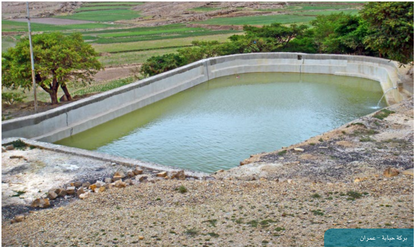
بركة حياية - عمران

المشاريع، حيث وصل عددها حتى نهاية عام 2013 إلى قرابة 50 ألف يوم عمل، الأمر الذي يساعد الأهالي على مواجهة أعباء المعيشة.