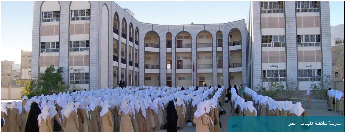
مدرسة عائشة للبنات - تعز

وخلال الربع تم في الجودة التعليمية عقد ورشة عمل لتحكيم "الرؤية- الرسالة - المجالات" من قِبَل ذوي الخبرة واساتذة الجامعات. وفي رياض الأطفال، تم الاستلام الابتدائي لمشروع مركز تنمية الطفولة المبكرة (في حي رسلان، مديرية الثورة، أمانة العاصمة)، والمكوّن من 3 قاعات للتدريب بأحجام مختلفة، ومكاتب إدارية ومرافق. كما تم في إطار البرنامج الوطني لرعاية الموهوبين الاستلام الابتدائي لمشروع تجهيز مدرسة الميثاق (في أمانة العاصمة أيضاً) بالمشاغل والورش التعليمية. وفي برنامج محو الأمية وتعليم الكبار، تم الانتهاء من تجريب منهاج محو الأمية الحرفية في 22 مركزاً للتدريب النسوي في 17 مديرية (في