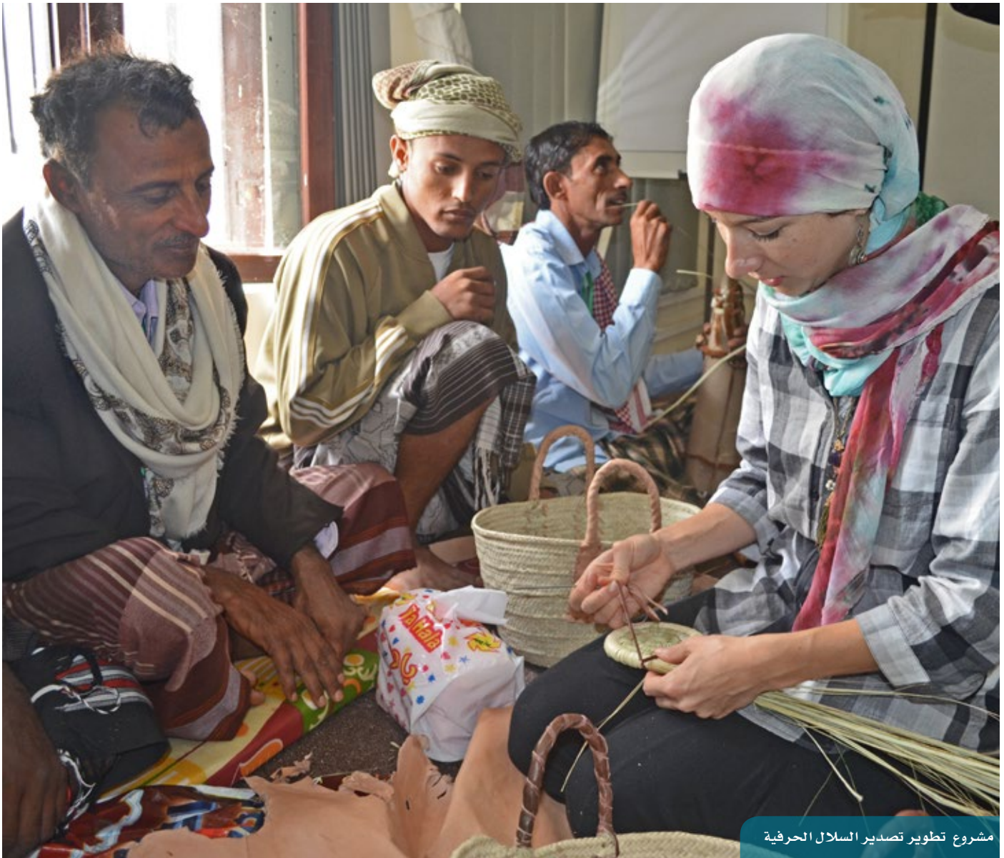
مشروع تطوير تصدير السلال الحرفية

دراسة احتياج السوق من عمالة الإنشاء: يهدف المشروع إلى تدريب وتأهيل خريجي قسم الهندسة المعمارية في مجال برنامج التصميم المعماري (الأوتوكاد) وبرنامج الإخراج